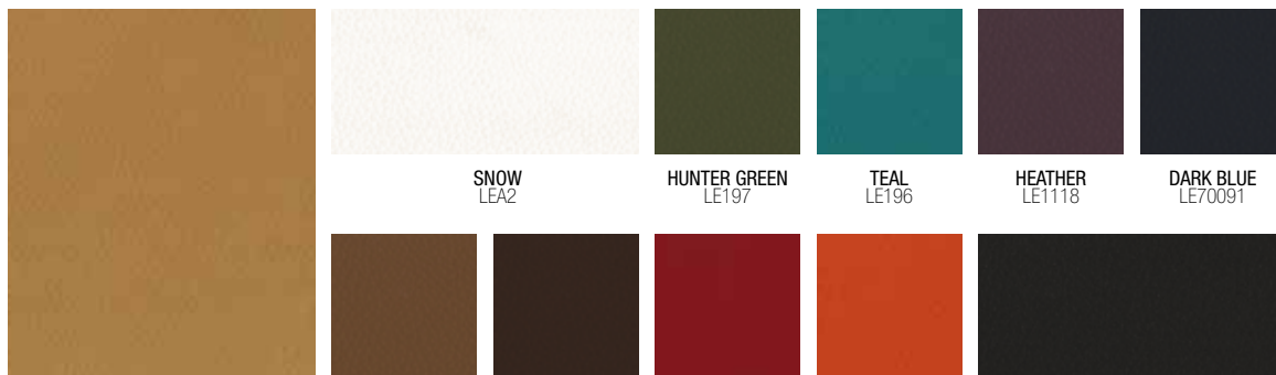
LIGHT TAN LE3902